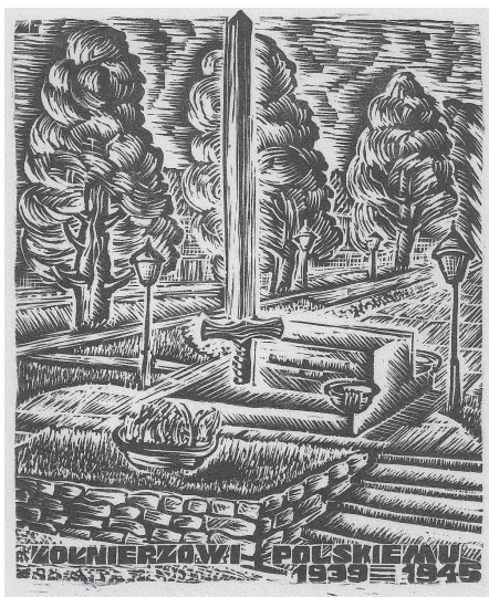
Cegielka na budowę pomnika Czynu Żołnierskiego.