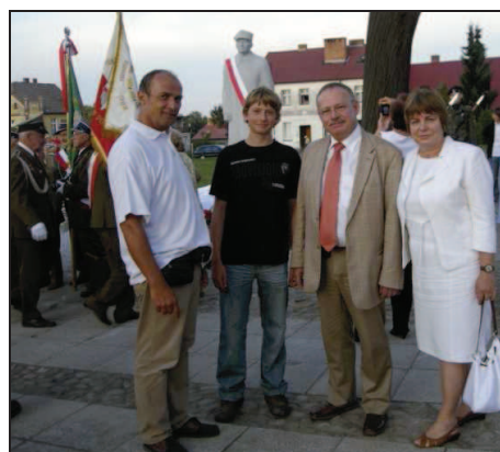
Sympatycy i członkowie Stowarzyszenia Woldenberczyków. Wrzesień, 2009.

Muzeum Woldenberczyków jest stałym miejscem ponadwojewódzkiego Konkursu Recytatorskiego Poezji Oflagu II C Woldenberg. W roku 2010 wzięło w nim udział około 80 uczniów szkół podstawowych i gimnazjum.