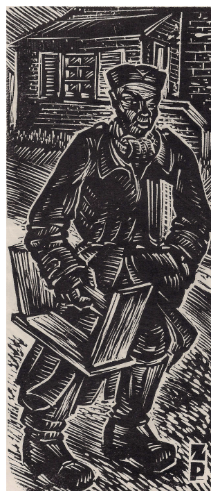
Po strawę duchową. Drzeworyt Z.Pazdy

Inną, równie popularną jak teatr, formą życia kulturalno-rozrywkowego była muzyka. W obozie zorganizowana została orkiestra symfoniczna por. Józefa Klonowskiego, różne formy kameralne, orkiestra mandolinistów